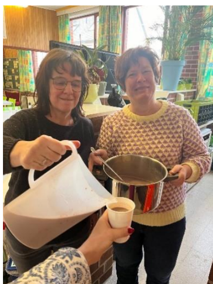
19/2 Dikke truiendag