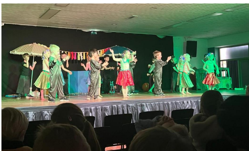
Onze oudste kleuters aan het werk