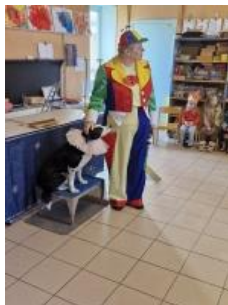
Clown op de Kruisstraat