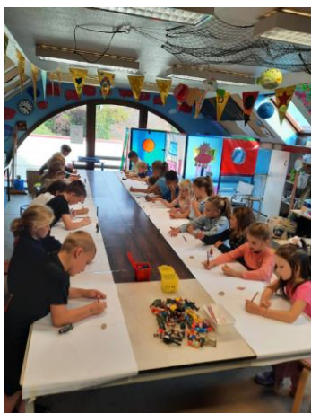
Workshop in de tekenacademie van Koewacht (L2)