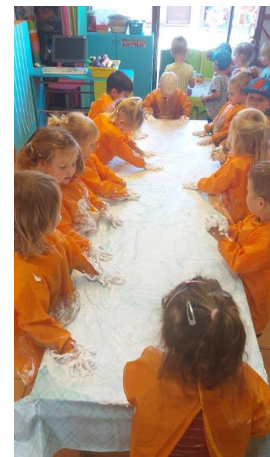
Schrijfdans met scheerschuim KB