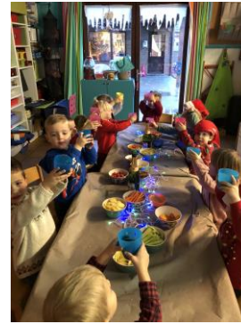
Kerstfeestje in de Teigetjesklas.

Een prachtige kerstviering voor de lagere klassen, georganiseerd door L2 en L3.